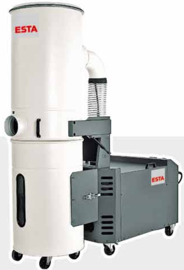
Filteranlage für Twin Belt